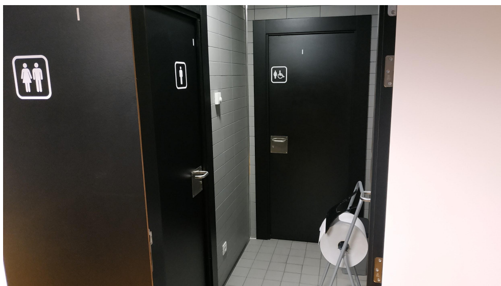
acceso a los aseos

Aunque habrá gel hidroalcohólico por todo el centro, se recomienda el lavado frecuente de manos. Para ello, se revisarán diariamente los dispensadores de jabón de los aseos. Las puertas de acceso a todos los aseos del centro permanecerán abiertas para evitar el contacto con las manillas.