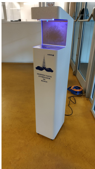
dispensador hidrogel acceso al centro

Nadie podrá tener tiempos de espera en los pasillos o zonas comunes, por lo que el acceso a las aulas habrá que realizarlo en el tiempo justo que se indique, y guardando siempre la distancia de seguridad con el resto de compañeros/as. Se dispondrá de medios de higiene de manos, tanto en los aseos, como en diferentes puntos del centro, tanto a la entrada, como en cada una de las plantas. Asimismo, habrá rollos de papel por todo el edificio para su uso en la desinfección de las aulas.