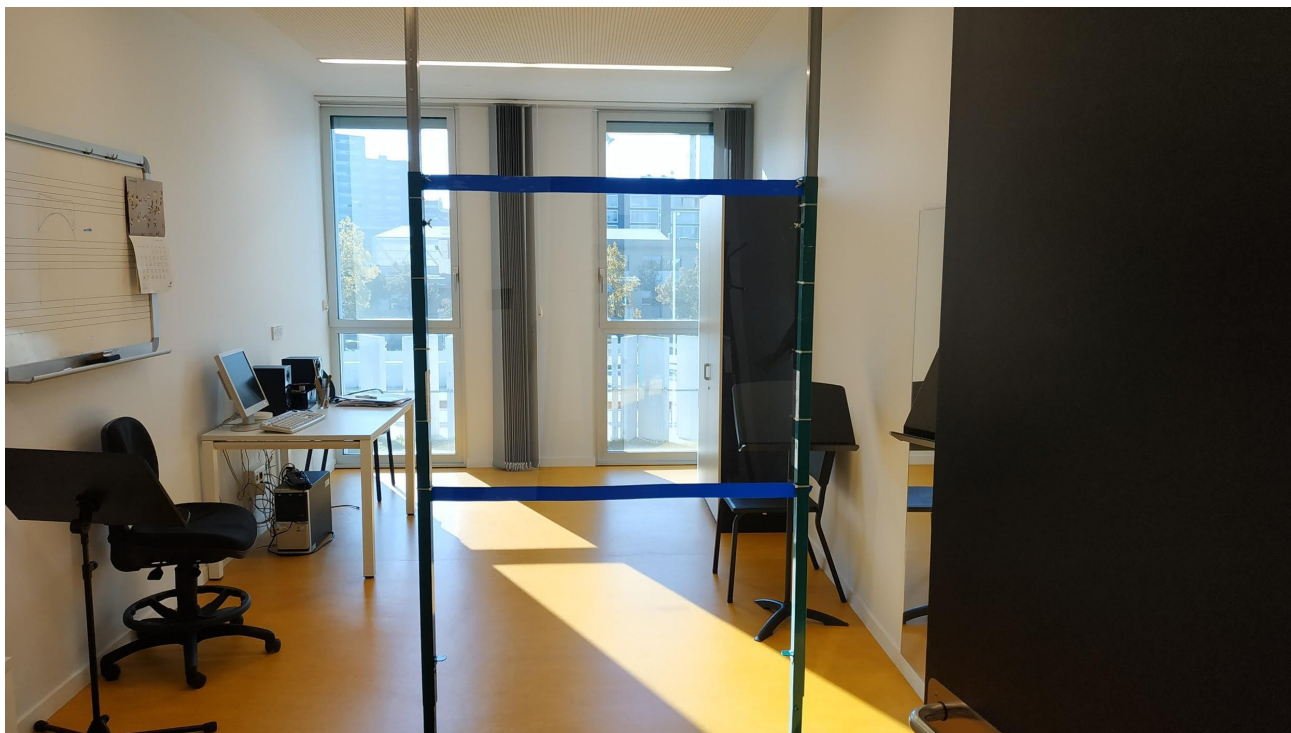
paneles de separación profesor - alumno en aulas de viento

El uso de la mascarilla será obligatorio tanto para el profesorado como para el alumnado salvo en las especialidades de viento madera, viento metal y Canto, donde podrán retirarse en los momentos de tocar o cantar (excepciones contempladas en el punto 8.2 de la Orden Foral 40/2020, de 28 de agosto ). En esas aulas, que contarán con paneles de separación y elementos absorbentes para los restos orgánicos, se mantendrá la distancia 1,5m y se adoptarán las medidas higiénicas y sanitarias necesarias.