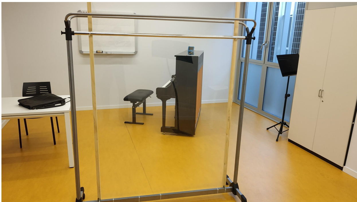
paneles de separación profesor - alumno en aulas de repertorio

Los profesores que imparten clase en las especialidades de viento y canto deberán utilizar mascarilla FFP2. También se han confeccionado mamparas móviles para su usos en aulas de canto y de pianista repertoristas.