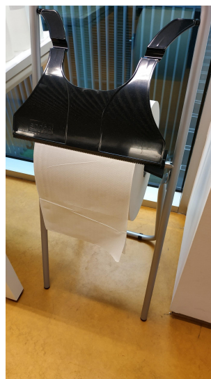
rollos para desinfección de las aulas