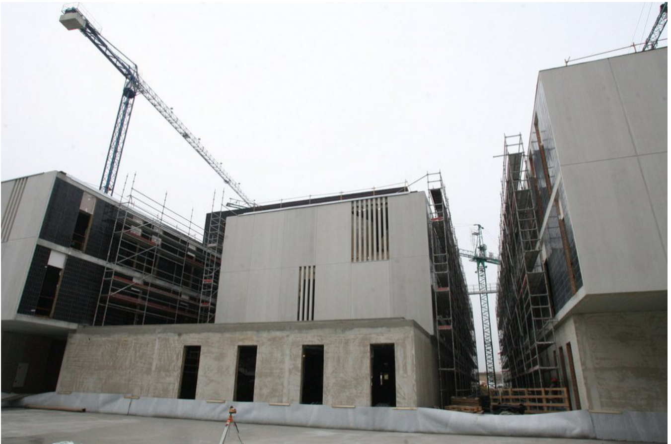
Imagen exterior del edificio que albergará la Ciudad de la Música