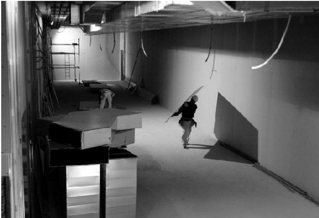
Uno de los amplios espacios del interior del edificio.