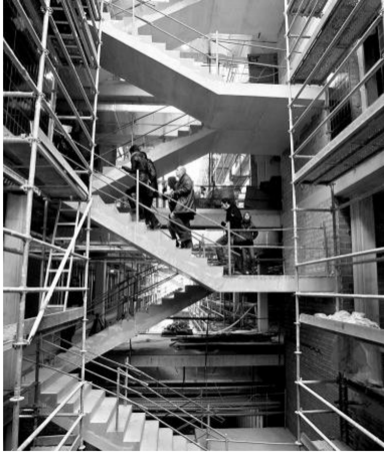
El edificio tendrá cuatro alturas: sótano, planta baja y dos pisos.