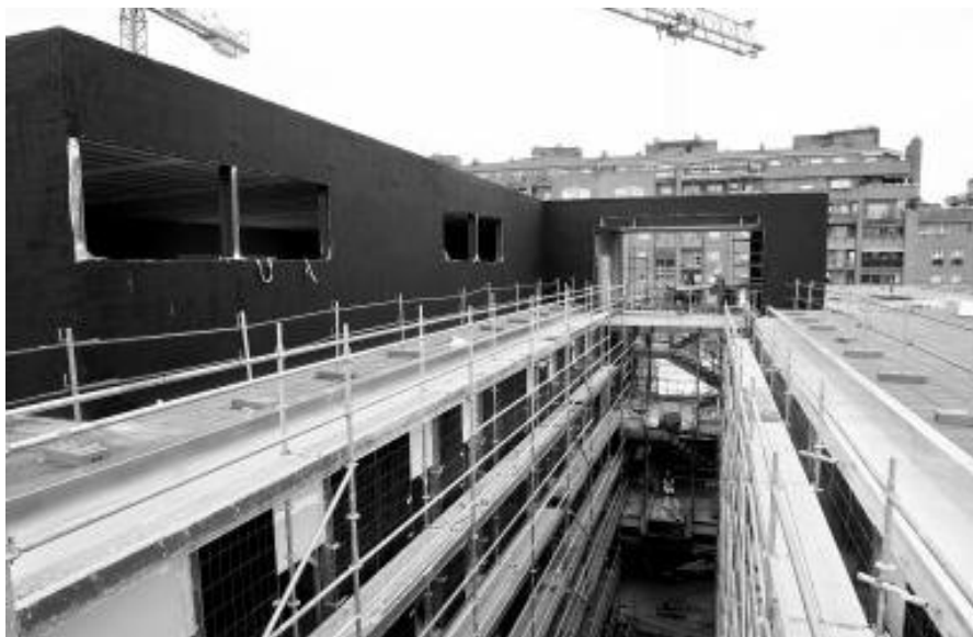
Vista desde el tejado de la division de los dos cubos.