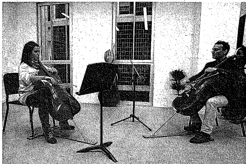
Dos alumnos interpretan una pieza en una de las aulas que fueron visitadas durante el recorrido.