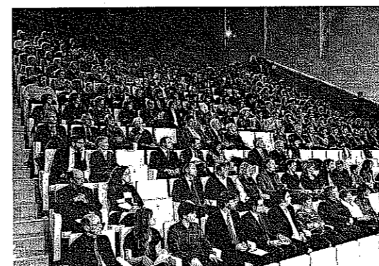
El auditorio, con 380 butacas, se llenó para la inauguración.