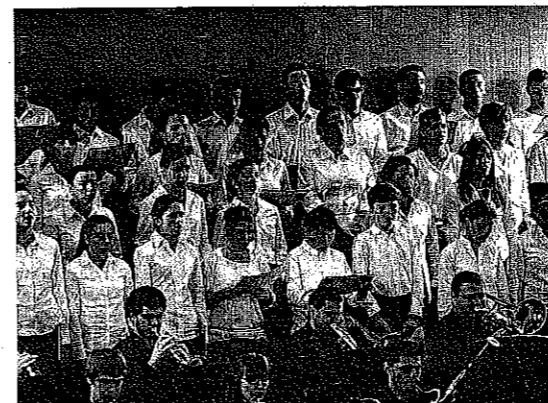
El coro y la orquesta ofrecieron un concierto con tres temas.