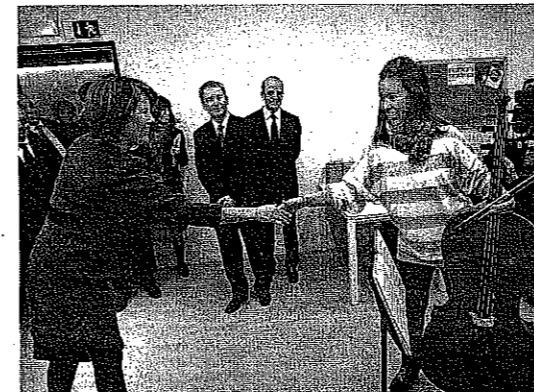
La presidenta Yolanda Barcina saluda a una alumna de violoncello. CORDOVILLA