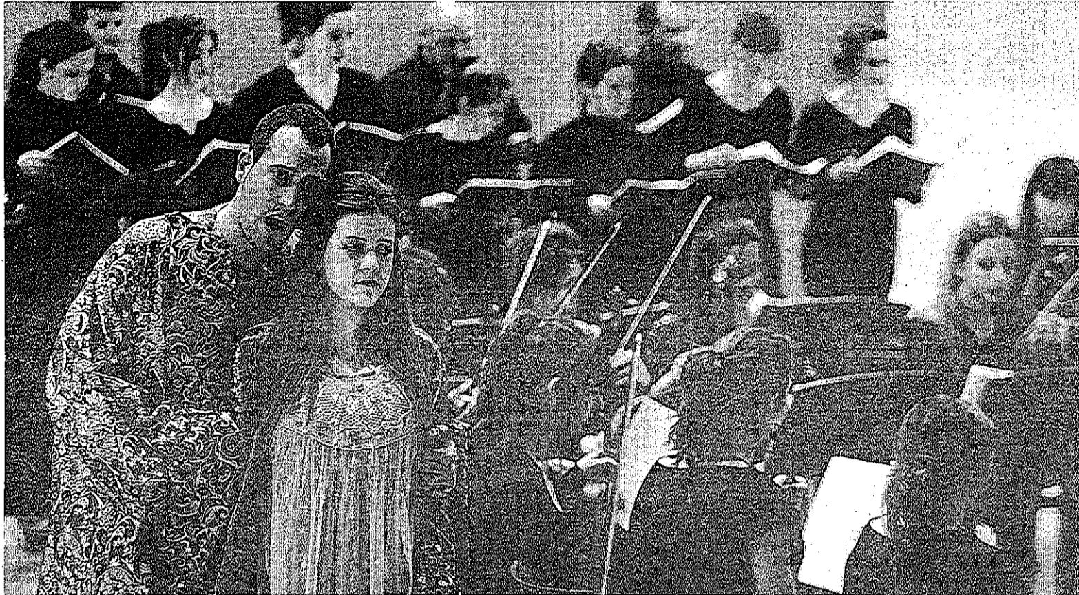
Un momento de la representación, semiescenificada, de la ópera.